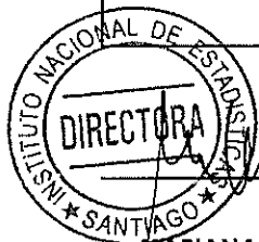
MARIANA SCHKOLNIK CHAMUDES DIRECTORA NACIONAL INSTITUTO NACIONAL DE ESTADÍSTICAS

Contar con los presupuestos financieros oportunamente para el Plan de las Estadísticas Publicas 2005 - 2008 Incrementar las partidas corrientes (sub 21, 22 y 33) a medidas que los proyectos ejecutados en el Plan de las Estadísticas Públicas 2005 – 2008 pasan al quehacer habitual del INE Gestionar el cambio del marco legal del INE