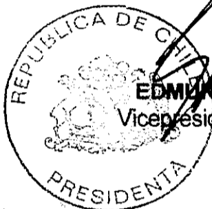
EDMUNDO PÉREZ YOMA Vicepresidente de la República